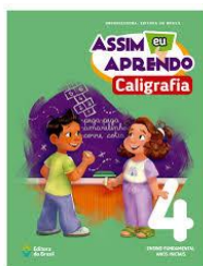
Assim eu aprendo Caligrafia 4 Ensino Fundamental – Anos iniciais Organizadora: Editora do Brasil Editora do Brasil