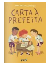
Carta à prefeita Autor: Fernando Carraro Editora FTD