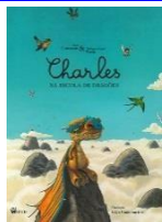
Charles na escola de dragões Autores: Alex Cousseau e Philippe Henri Turin Editora FTD