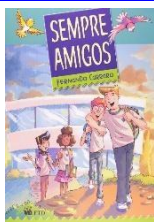
Sempre amigos Autor: Fernando Carraro Editora FTD