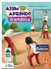
Assim eu aprendo Gramática 4 Ensino Fundamental – Anos iniciais Organizadora: Editora do Brasil Editora do Brasil

Educação Socioemocional – 4º ano Escola da Inteligência Vendas a partir de 08/01/2025