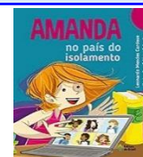
Amanda no país do isolamento Autor: Leonardo Mendes Cardoso Editora do Brasil