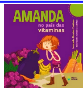
Amanda no país das vitaminas Autor: Leonardo Mendes Cardoso Editora do Brasil