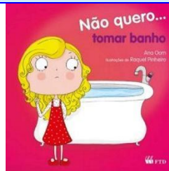
Não quero tomar banho Autor: Ana Oom Editora FTD