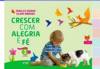
Crescer com Alegria e Fé 1 – Educação Infantil Autores: Ednilce Duran e Glair Arruda Editora FTD