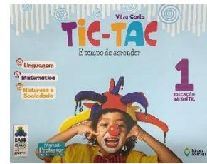
Tic-Tac Seriado – Vol. 1 Linguagens, Matemática, Natureza e Soc. Autora: Vilza Carla Editora do Brasil

Programa Bilingue – 1º Período Edify Vendas a partir de 08/01/2025