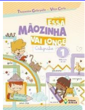
Essa mãozinha vai longe - Caligrafia 1 – Educação Infantil - Nova Edição Autores: Thyanne Gabryelle e Vilza Carla Editora do Brasil