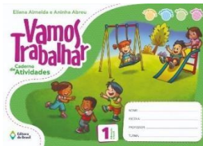
Vamos Trabalhar – Caderno de Atividades 1 – Educação Infantil (Não encadernar) Autores: Eliana Almeida e Aninha Abreu Editora do Brasil