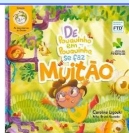
De pouquinho em pouquinho, se faz muito (Ed. Financeira) Autora: Carolina Ligocki Distribuição FTD