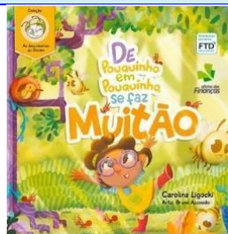
De pouquinho em pouquinho, se faz muito (Ed. Financeira) Autora: Carolina Ligocki Distribuição FTD