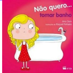
Não quero tomar banho Autor: Ana Oom Editora FTD