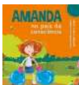
Amanda no país da consciência