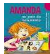
Amanda no país do isolamento