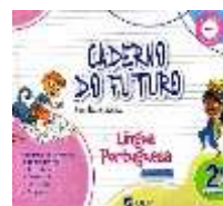
Caderno do Futuro – Língua Portuguesa 2º Ano – Ensino Fundamental Editora IBEP

Autoras: Angela A. Cantele e Bruna R. Cantele Editora IBEP