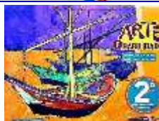
Arte e Habilidade 2º Ano – Ensino Fundamental

Autoras: Ednilce Duran e Glair Arruda Editora FTD