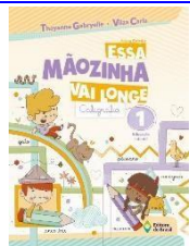
Essa mãozinha vai longe - Caligrafia