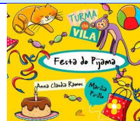
Festa do Pijama

Autor: Donaldo Buchweitz e Ieda Silva Editora Ciranda Cultural