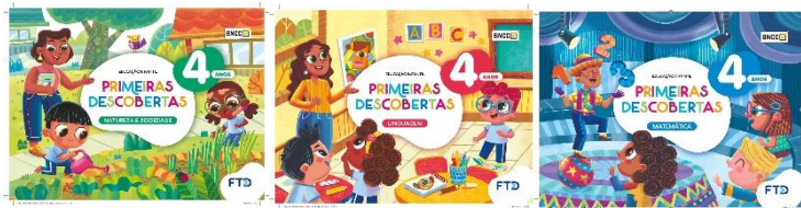
Primeiras Descobertas – 4 anos – Educação Infantil Linguagem, Matemática e Natureza e Sociedade

Autores: Sorel Silva, Júnia La Scala, Arnaldo Rodrigues Editora FTD