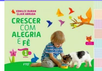
Crescer com Alegria e Fé