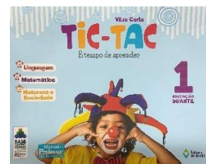
Tic-Tac Seriado – Vol. 1 Linguagens, Matemática, Natureza e Soc.