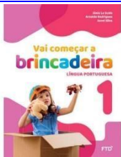
Vai começar a brincadeira - 1 Língua Portuguesa

Autores: Sorel Silva, Júnia La Scala, Arnaldo Rodrigues Editora FTD