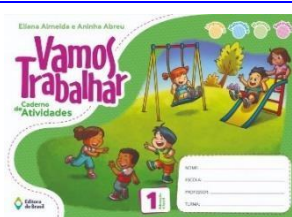
Vamos Trabalhar – Caderno de Atividades 1 – Educação Infantil (Não encadernar)

1 – Educação Infantil - Nova Edição Autores: Thayanne Gabryelle e Vilza Carla Editora do Brasil